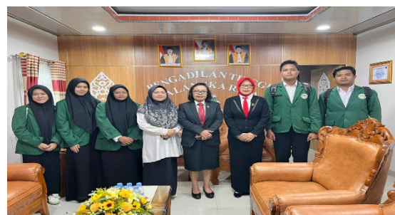
Kunjungan ke PN Palangkaraya