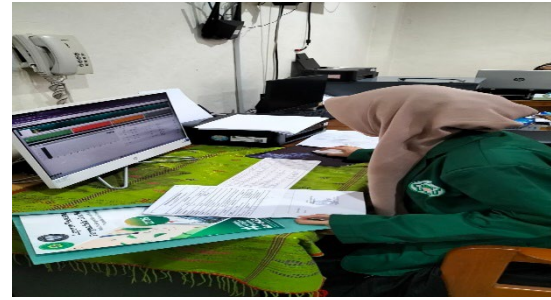
Mendisposisi surat masuk pada aplikasi SIPP