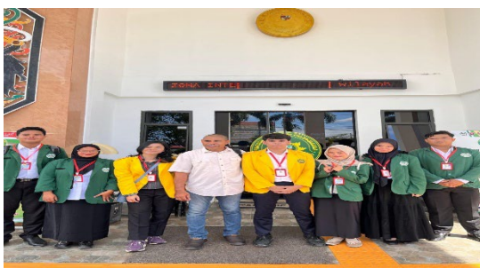
Pengantaran Mahasiswa PKH

Mahasiswa juga berpartisipasi secara aktif dalam kegiatan kajian rutin yang diselenggarakan di Mushola Al-Hakim Pengadilan Tinggi Palangkaraya dengan intensitas dua kali dalam sebulan. Program ini memiliki daya guna krusial dalam memperkokoh kecerdasan spiritual dan integritas moral mahasiswa sebagai calon penegak hukum. Melalui penguatan nilai-nilai etika dan religiusitas ini, mahasiswa diharapkan tidak hanya unggul secara intelektual dalam penguasaan hukum positif, tetapi juga memiliki landasan karakter yang berintegritas dan humanis dalam menjalankan profesi hukum di masa depan.