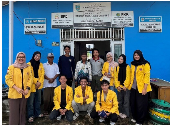
Gambar 1. Foto Tim di Kantor Desa

Pemberdaya dan Kesejahteraan Keluarga (PKK), dan tokoh masyarakat, serta Focus Group Discussions (FGD) untuk memvalidasi temuan awal dan menetapkan prioritas permasalahan.