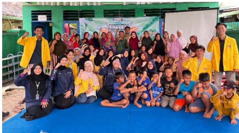
Gambar 4. Dokumentasi Kegiatan di PAUD Bahagia

Temuan lapangan menunjukkan bahwa mayoritas orangtua masih menerapkan pola asuh otoriter dengan komunikasi satu arah dan minimnya ruang ekspresi bagi anak. Bias peran gender juga masih sangat kuat dengan dominasi pandangan bahwa pengasuhan anak adalah tanggung jawab eksklusif ibu. Diskusi yang berlangsung selama sesi edukasi berhasil mendorong sejumlah peserta untuk merefleksikan pola pengasuhan mereka dengan beberapa orangtua mengakui bahwa pendekatan otoriter yang mereka terapkan berasal dari pengalaman pengasuhan yang mereka terima sendiri di masa kecil, bukan dari pemahaman tentang kebutuhan perkembangan anak.