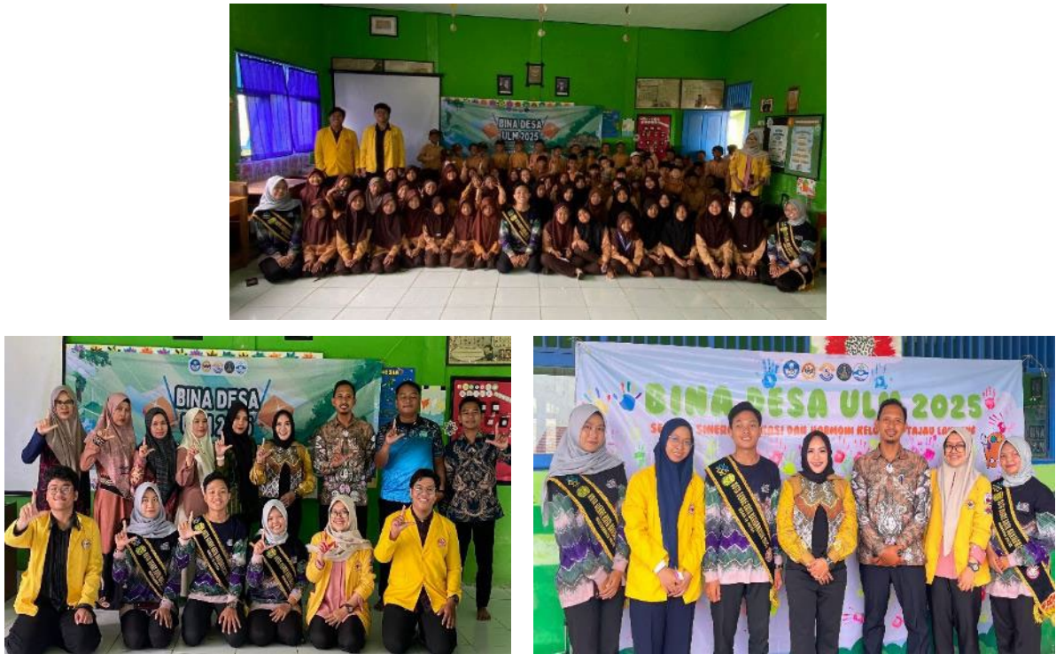
Gambar 2. Dokumentasi Kegiatan di SDN 1 Tanjau Landung