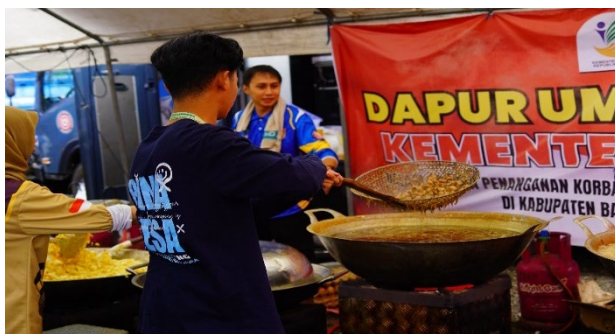
Gambar 5. Dokumentasi di Dapur Umum Dinas Sosial

Keterlibatan tim dalam respons bencana juga memberikan dampak tidak langsung yang besar bagi keberhasilan program pengabdian secara keseluruhan. Kepercayaan dan ikatan emosional yang terbangun antara tim dan warga selama masa darurat membuat masyarakat lebih terbuka dan reseptif terhadap program-program edukatif yang dilaksanakan. Hal ini membuktikan teori bahwa kepercayaan sosial (social trust) merupakan prasyarat penting bagi efektivitas program pemberdayaan masyarakat berbasis partisipasi.