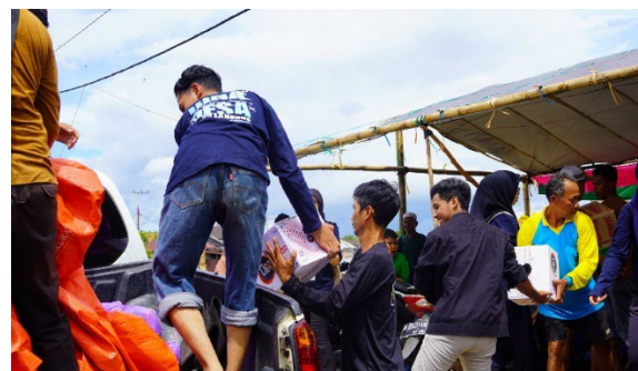
Gambar 6. Dokumentasi Distribusi Bantuan Sembako