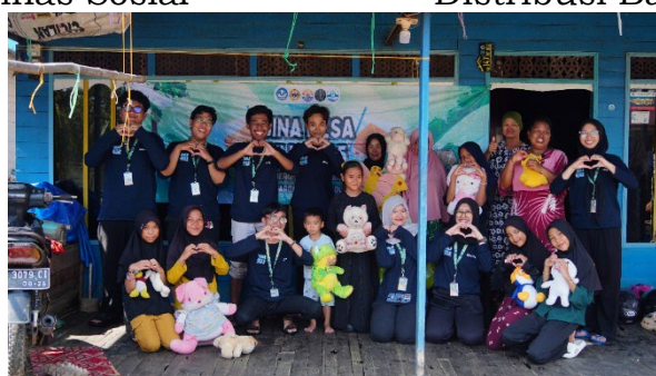
Gambar 7. Pemberian Boneka Kepada Anak-Anak